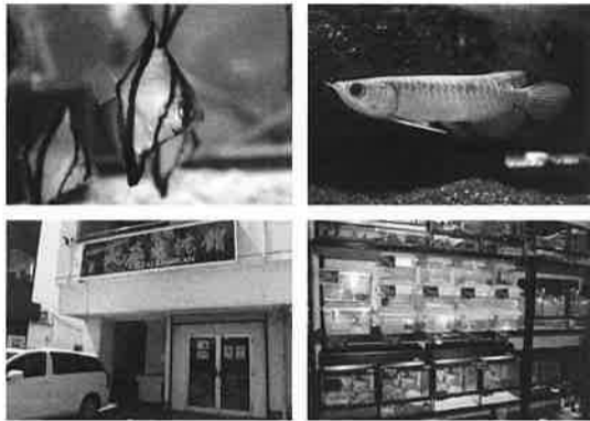
上)アクアシヨップ大在魚見館、下)レプタイルズシヨップ大在亀蛇館

本社は大分市政所ですが、青崎、牧、流通業務団地と拠点が増え、城原にはアクアシヨップとレプタイルズシヨップも展開しています。