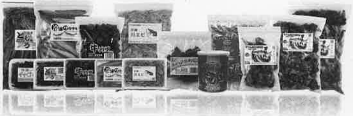
中・大型魚用の冷凍餌。どれも鮮度にこだわった商品です。