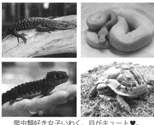
爬虫類好き女子いわく、目がキュート♡。

爬虫類は哺乳類と比べて手間がかからず、一人暮らしでもペットとして飼いやすいのが特徴です。温度や湿度などに気を付ければ、鳴き声も大きくなく、賃貸物件でも飼いやすいのが魅力です。